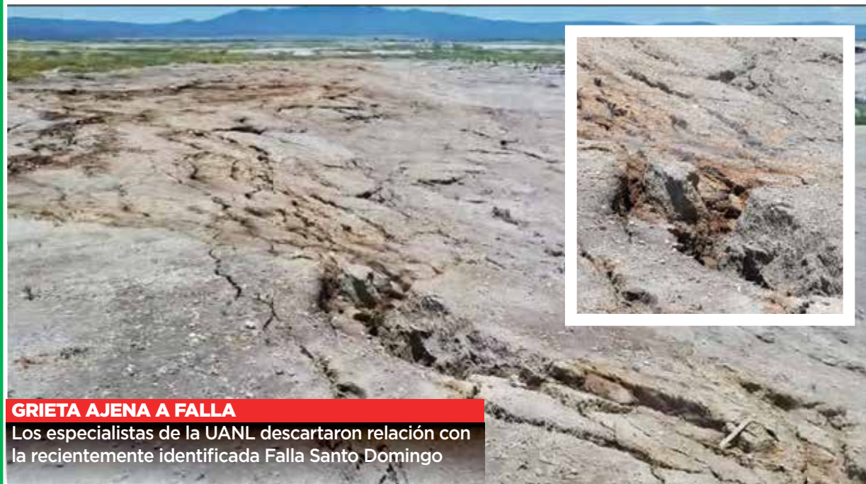
GRIETA AJENA A FALLA

Los especialistas de la UANL descartaron relación con la recientemente identificada Falla Santo Domingo