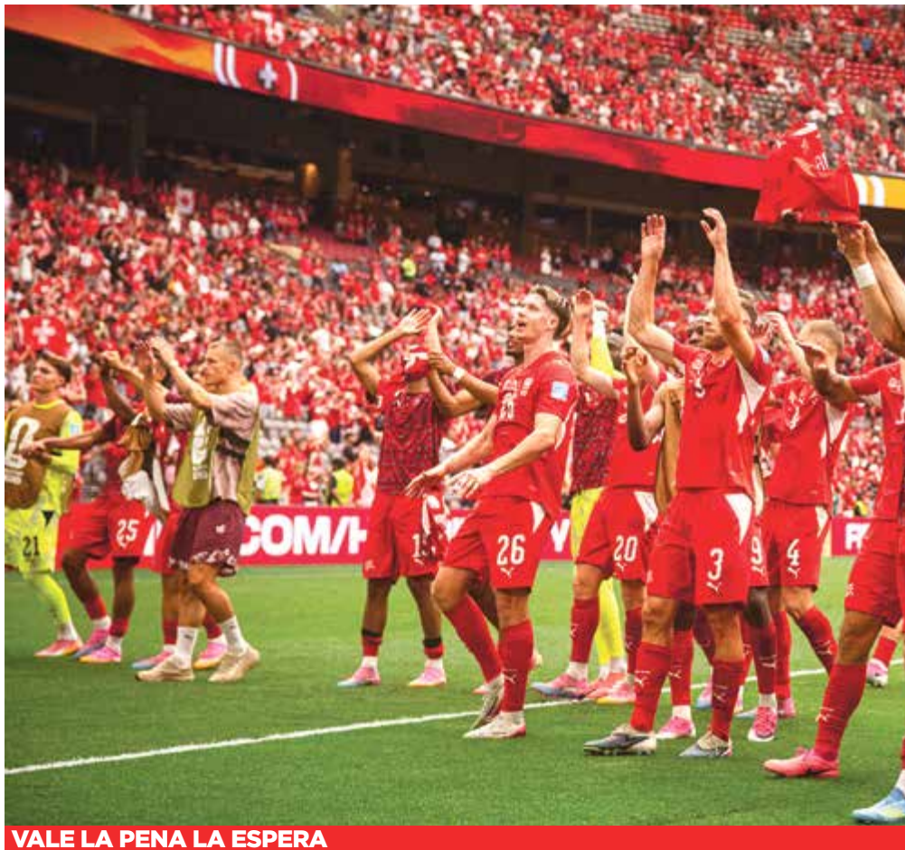
VALE LA PENA LA ESPERA

Con este resultado, los helvéticos alcanzan por cuarta