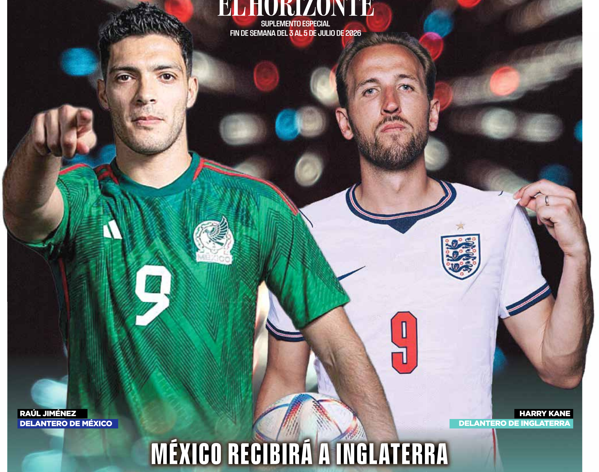
RAÚL JIMÉNEZ DELANTERO DE MÉXICO

SUPLEMENTO ESPECIAL FIN DE SEMANA DEL 3 AL 5 DE JULIO DE 2026