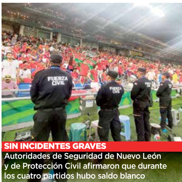
SIN INCIDENTES GRAVES

Autoridades de Seguridad de Nuevo León y de Protección Civil afirmaron que durante los cuatro partidos hubo saldo blanco