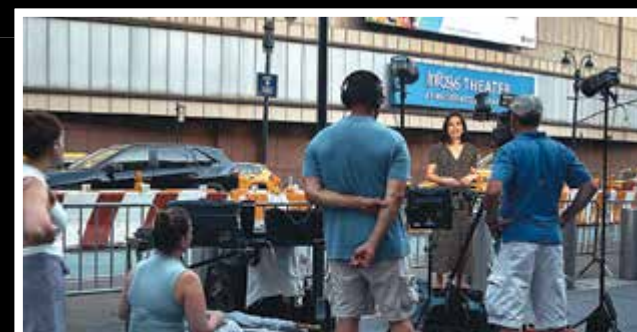
GRAN MOVILIZACIÓN Proveedores de la boda, policías, camionetas lujosas y con vidrios oscuros, prensa y fans estuvieron alrededor del lugar ayer